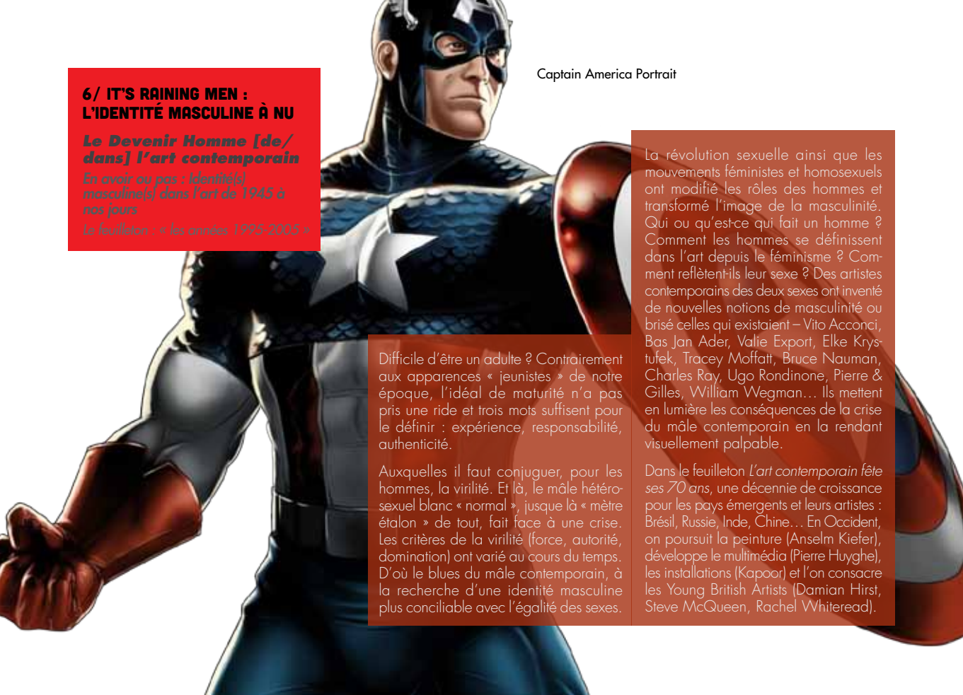
Captain America Portrait