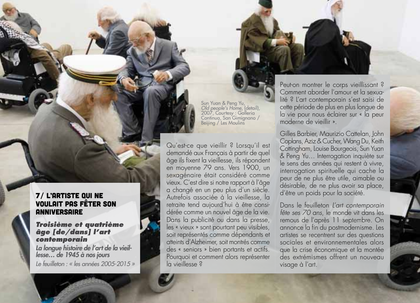
Sun Yuan & Peng Yu, Old people's Home , (detail), 2007, Courtesy : Galleria Continua, San Gimignano / Beijing / Les Moulins