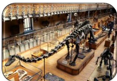
diplodocus RDV à 14h30 1 er étage

Pour chaque point parole : présentation 15 mn + échanges libres 30 mn