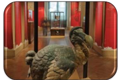
dodo RDV à 16h30 2 ème étage, entrée de la Galerie des Espèces menacées et disparues

Grande Galerie de l'Evolution - 36 rue Geoffroy Saint Hilaire - 75005 Paris Visiteurs individuels et familles – tous âges à partir de 5 ans