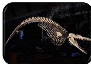
archéocète RDV à 16h30 1 er étage

Galerie de Paléontologie et d'Anatomie comparée - 2 rue Buffon - 75005 Paris Visiteurs individuels et familles – tous âges à partir de 8 ans