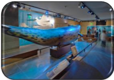
narval RDV à 14h30 rez-de-chaussée au fond à gauche

Pour chaque point parole : présentation 15 mn + échanges libres 30 mn