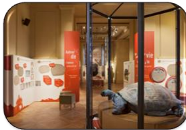
Kiki la tortue RDV à 15h30 2 ème étage, salle au fond à droite