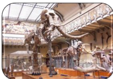
mammouth RDV à 15h30 1 er étage